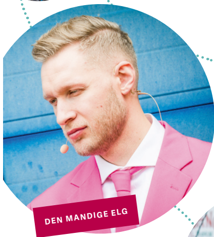
DEN MANDIGE ELG