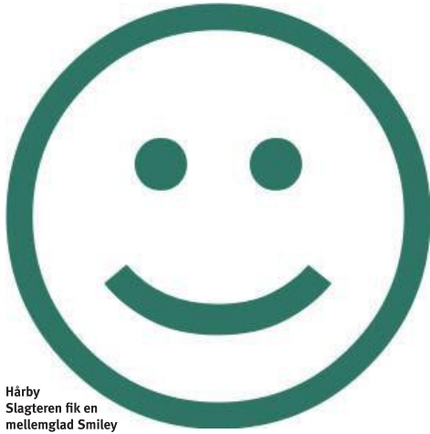
Hårby Slagteren fik en mellemglad Smiley ved seneste kontrolbesøg.